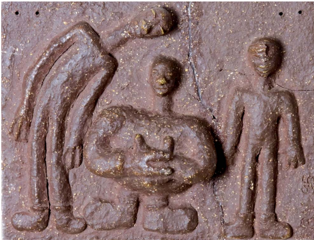
1995 26 x 33 cm; 45 x 48 cm (s deskou)