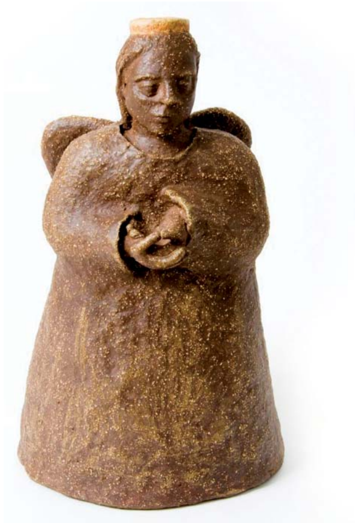
2008 (vytvořeno během sochařského sympozia v MRK 2008) v: 62 cm, ø 32 cm