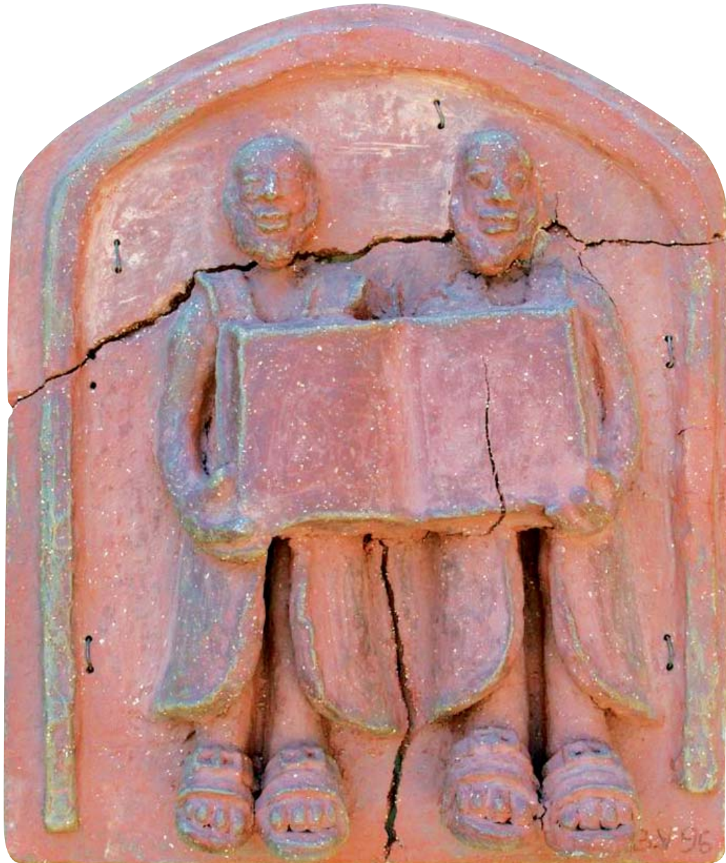
Cyrlil a Metoděj 1996, 52 x 43,5 cm; 69 x 55 cm (s deskou)