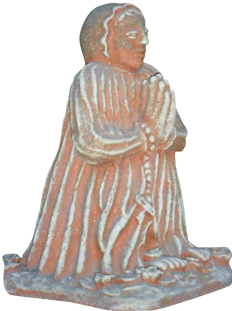
Romská madona 2000