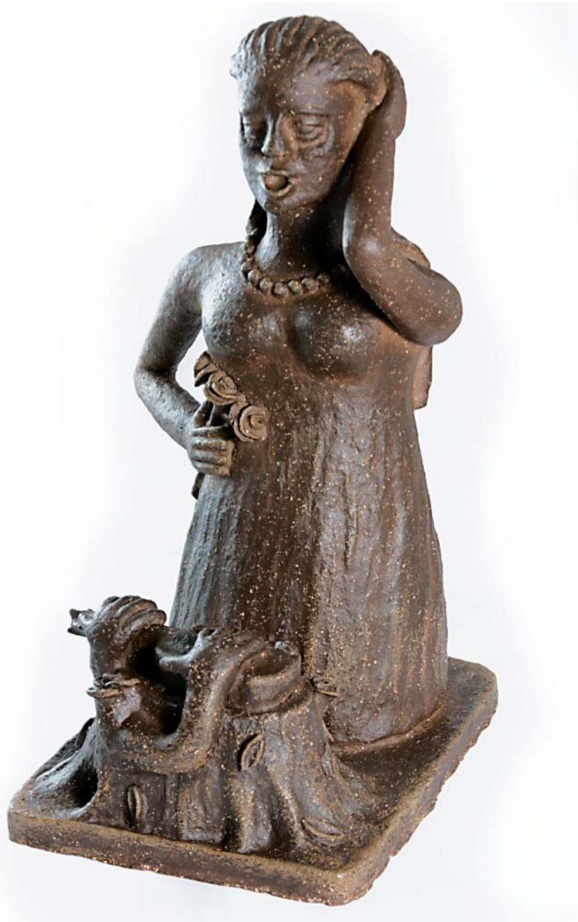
Čarovné housle 2010 (vytvořeno během sochařského sympozia v MRK 2010), v: 60 cm; 40 x 27,5 cm