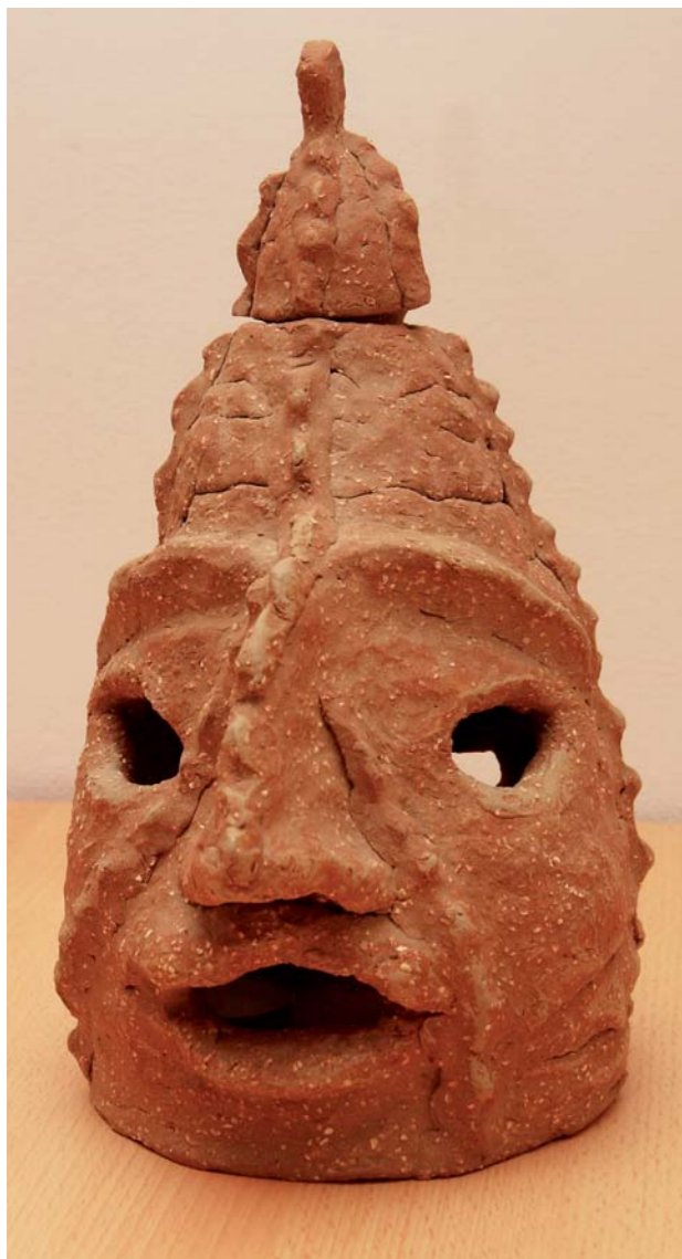
Dýně – aromalampa