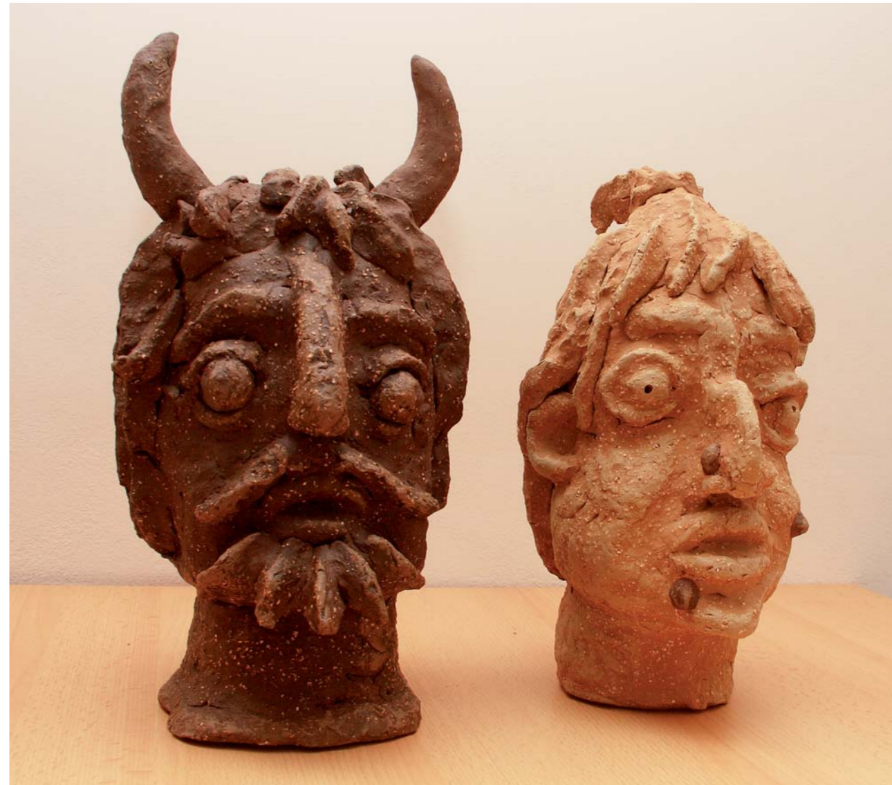
Čert a čarodějnice