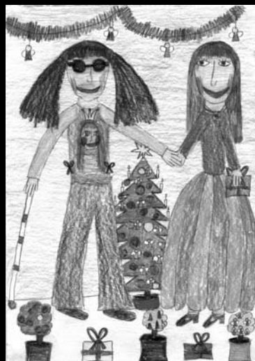
Vánoční kresba – děti dětem