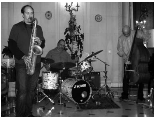
Americké jazzové kvarteto hraje na společně připravované akci Ambasády USA a sdružení Okamžik