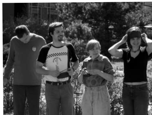
Z výcviku dobrovolníků – zkouška „nevidění“