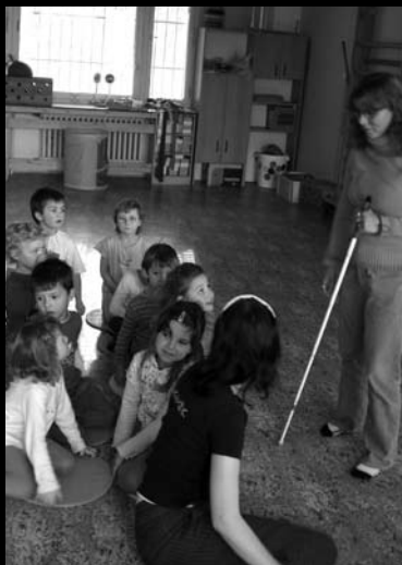
O záhadách bílé hole – ze semináře pro mateřské školy

Životně důležité věci jsou jednoduché: voda a dobrá vůle Veolia Voda a Nadační fond Veolia Voda