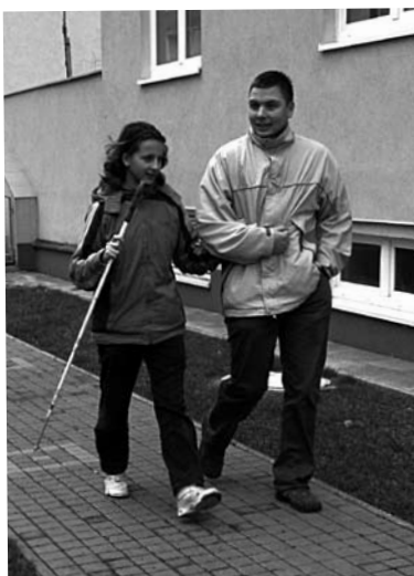
Na cestě do Okamžiku – vedoucí dobrovolnického centra a klientka dětské asistence